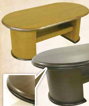
安心・安全な天板形状