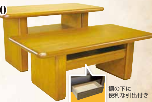
棚の下に 便利な引出付き