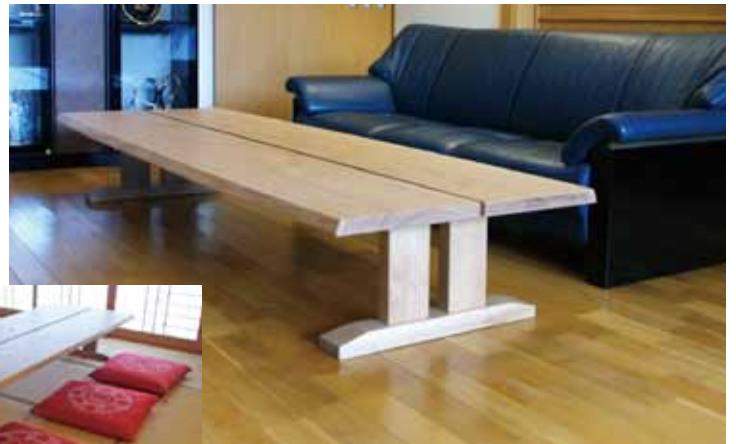
和室にも洋室にも合うナチュラルテイスト